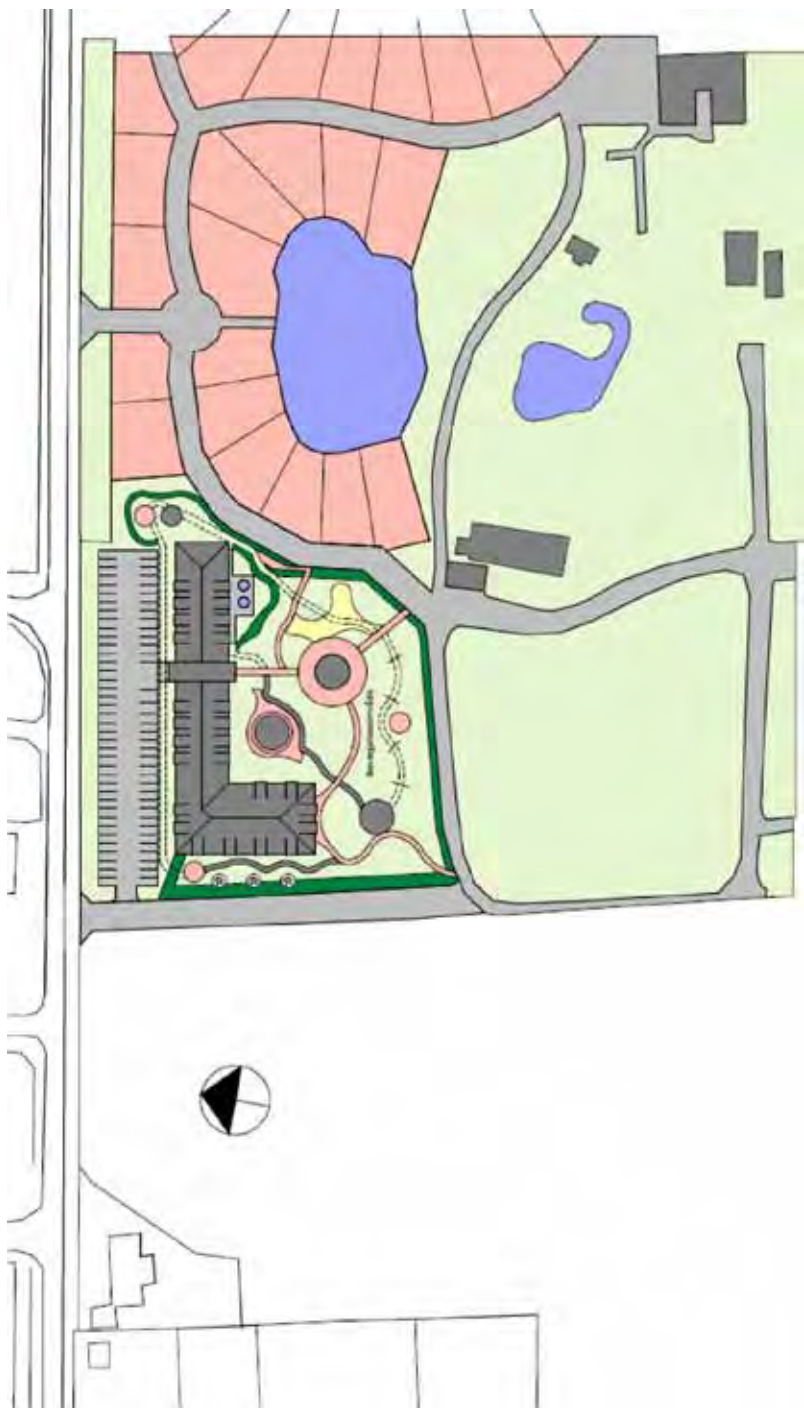
Foreløbig skitse af husets placering